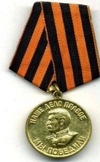
Юбилейная медаль за победу над Германией в Великой Отечественной войне 1941-1945 годов