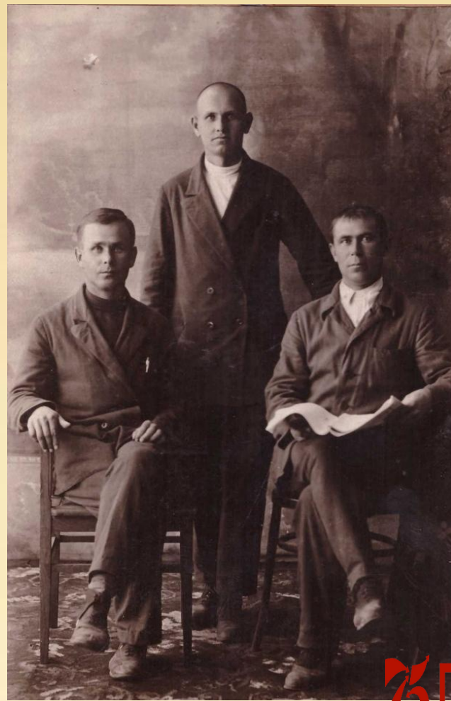
Обучение в путевой ремонтной колонне (посередине)