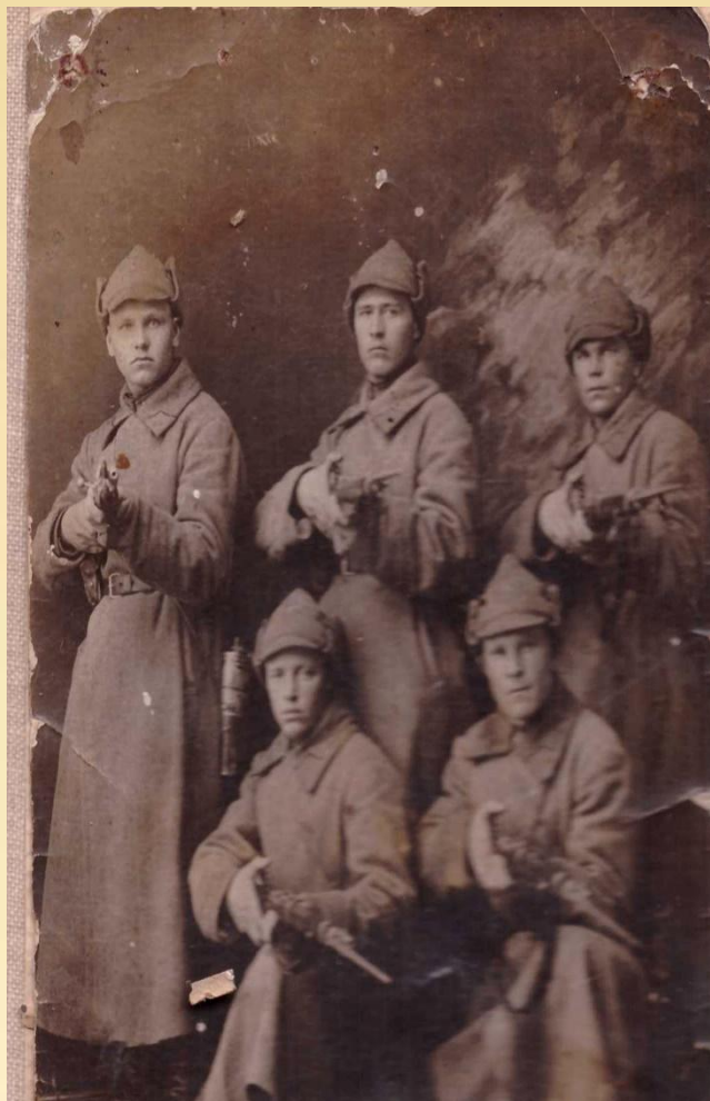
Служба в рядах Рабоче-Крестьянской Красной Армии, 01 марта 1928 год (стоит слева крайний)

С 1938 года трудился в Погрузочно-транспортном управлении станции Горняцкая дорожным мастером, потом старшим дорожным мастером.