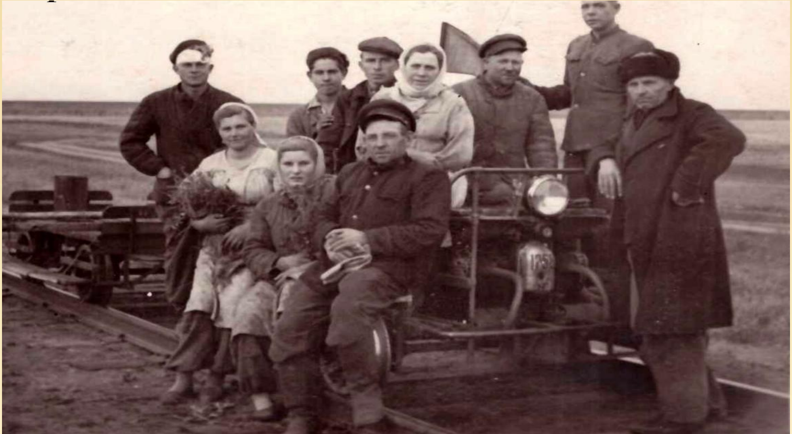
Старший дорожный мастер, ст. Горняцкая (крайний справа)